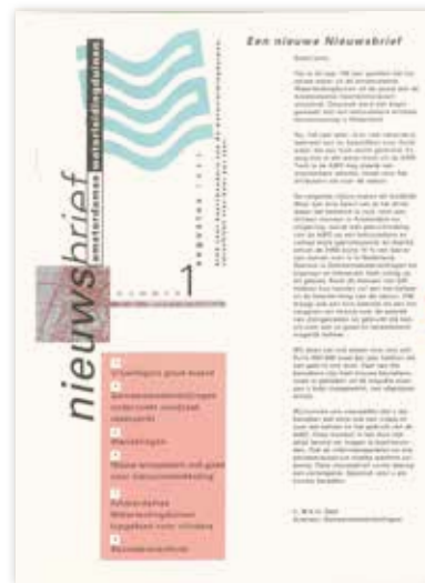
De eerste nieuwsbrief uit 1993

"Vergeleken met 1993 zien we een verdubbeling van het aantal vrijwilligers, van 100 naar 200",